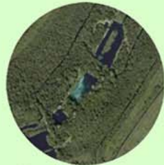
Kooi van Pen