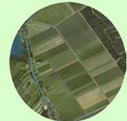
Polder Wetering Oost