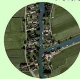
Eind van 't Diep