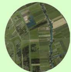
Polder Wetering West